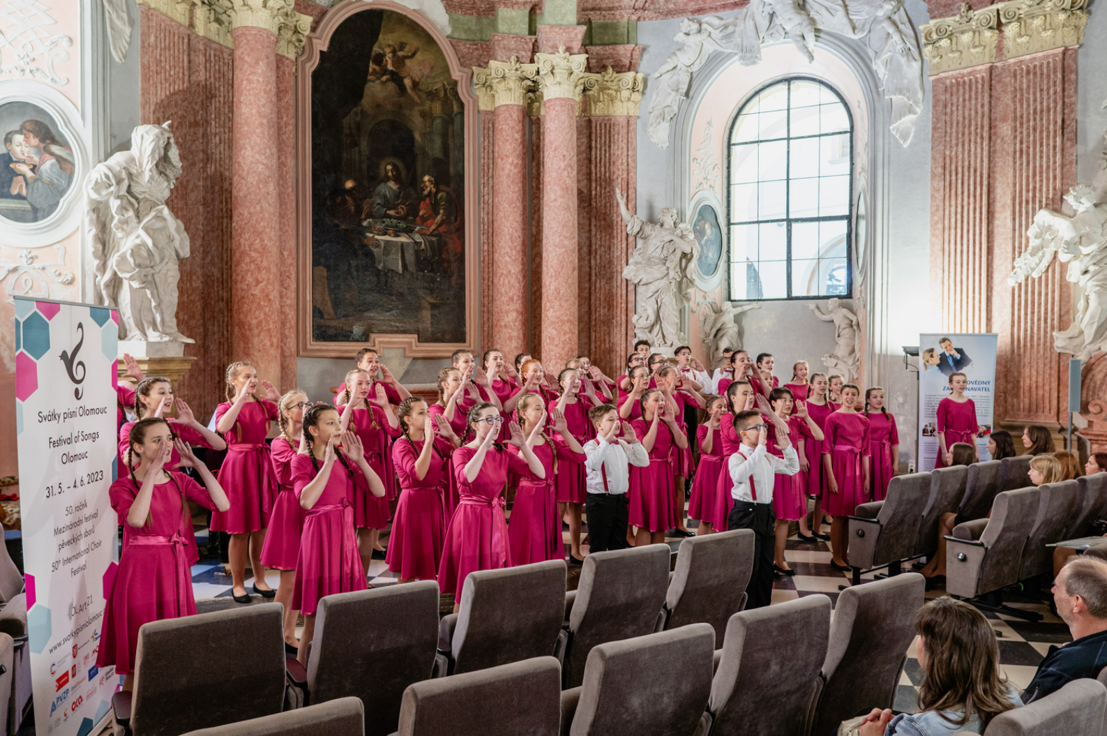
Soutěž MUNDI CANTANT, sbor: Kajetán (3. 6. 2023, Kaple Božího Těla)

Festival se zaměřuje na amatérské hudební umění již od svého vzniku. Jeho hlavním posláním je: